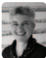
Artista Textil, diseñadora y fabricante